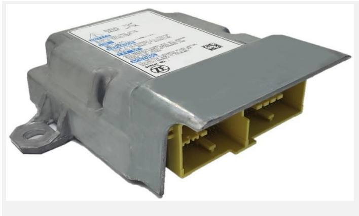
Imagem ou desenho esquemático

Módulo de Controle Eletrônico (ECU) de gerenciamento do Sistema Suplementar de Segurança (SRS) de veículos de passeios e comerciais leves, para regular e controlar o acionamento das bolsas de ar (airbags) e dos pré-tensionadores dos cintos de segurança, construído de carcaça de alumínio zincado e conectores plásticos com duas cavidades. O módulo possui algoritmos que permitem a classificação de ocupantes e a proteção de pedestres, com base em sensores instalados no para-choque para a detecção de colisões frontais, traseiras, laterais e capotamentos, sensores de aceleração e de pressão, memória para gravação de múltiplos eventos de dados (EDR). Contém placa de circuito impresso, conectores elétricos, unidade eletrônica, circuito elétrico de disparo. Inclui funções de autodiagnóstico e comunicação via rede CAN. Com dimensões aproximadas de 125,4 mm x 122,5 mm x 32,6 mm e peso de 440 g.